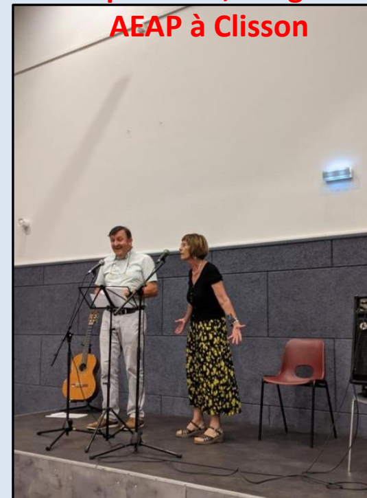
Septembre, congrès AEAP à Clisson